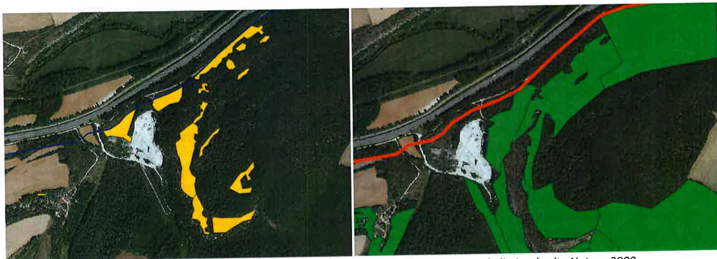
Zones de pelouses calcaires (orange) et de forêts de pente (vert). En rouge, la limite du site Natura 2000. Source : Document d'Objectif de la ZPS « Arrière côte de Dijon et de Beaune

A noter que ces milieux à enjeux, notamment les pelouses, sont en très forte régression à l'échelle régionale. Outre ce classement, les boisements et les zones ouvertes intraforestières sont très favorables à l'avifaune (zone de chasse, zone de nidification potentielle). Ces habitats constituent un habitat d'espèce pour l'avifaune : leur suppression engendrerait donc une perte de territoire de nidification et/ou de chasse, notamment pour les espèces de la Directive ou protégées citées ci-dessus.